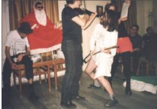
A mi Mikink és a haverok