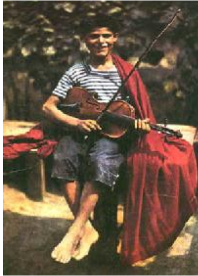
Sztnojevics: Cigányfiú hegedűvel

haladtunk a kisbolt felé, hogy vásároljak neki valamilyen csokit, hiszen útközben elfogadta a meghívásom. Megkérdeztem kissé mosolygósan, hogy mi leszel, ha nagy leszel? Ő rám nézett és jött az egyszerű válasz: SEMMI . Húha, mondtam neki, ez nem nagy terv, ami azt illeti. Még egyszer feltettem a kérdést, de most már komolyabb választ vártam tőle, amire gondolom rájött, hiszen egy kicsit a gondolataiba mélyedve tipegett mellettem, majd kisvártatva jött a válasz: kocsiszerelő . Ez szép elgondolás, mondtam neki, hiszen már megint abban a helyzetben voltam, hogy nem találtam szavakat. Rám nézett és boldognak tűnt, hogy milyen szép tervei vannak, és szemmel láthatólag nagyon büszkén lépkedett mellettem. Még azt is megkérdeztem, hogy milyen kocsit szeretne, és ő megint csak széles mosollyal, most már rögtön, azt válaszolta, hogy dzsipet szeretne. Már mondtam volna, hogy nekem is az a kedvenc