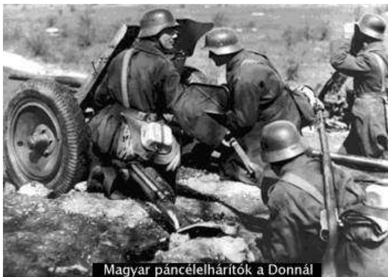
Magyar páncélelhárítók a Donnál