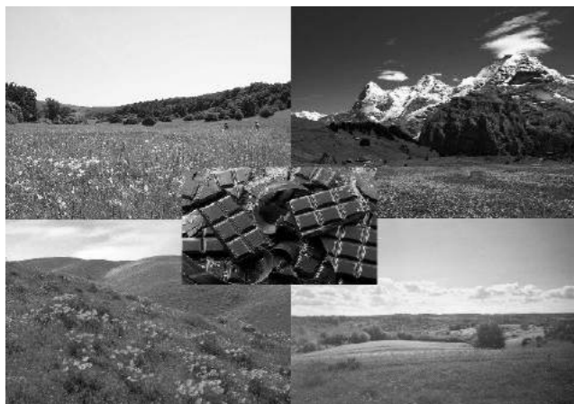
Szabó Zsombor Barnabás

http://antique-city.shp.hu/hpc/kepgaleria/antique-city/antique-city_12225237069_porcelan_es_keramia_WxK_KI_SKEP.jpg