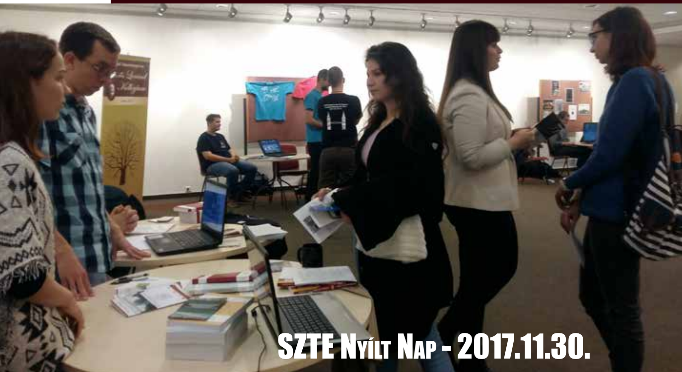
SZTE NYÍLT NAP - 2017.11.30.

A lenti fotók az alábbi rendezvényeken való részvételünkről tanúskodnak, de részt vettünk a TTIK január 13-i nyílt napján is: