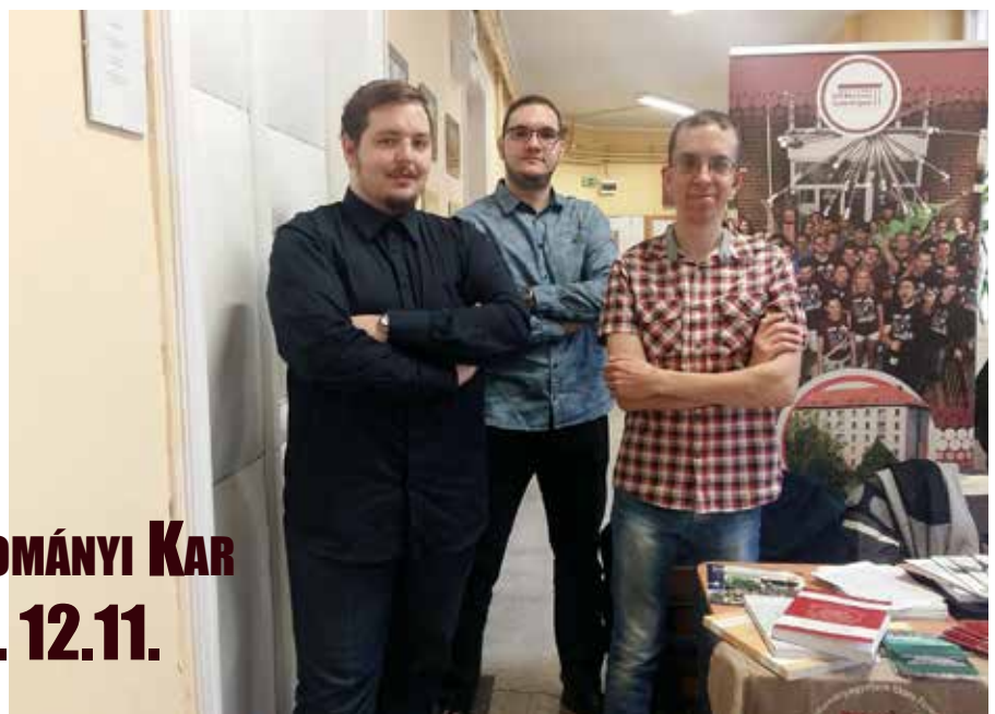
SZTE BÖLCSEZETTUDOMÁNYI KAR NYÍLT NAP - 2017. 12.11.