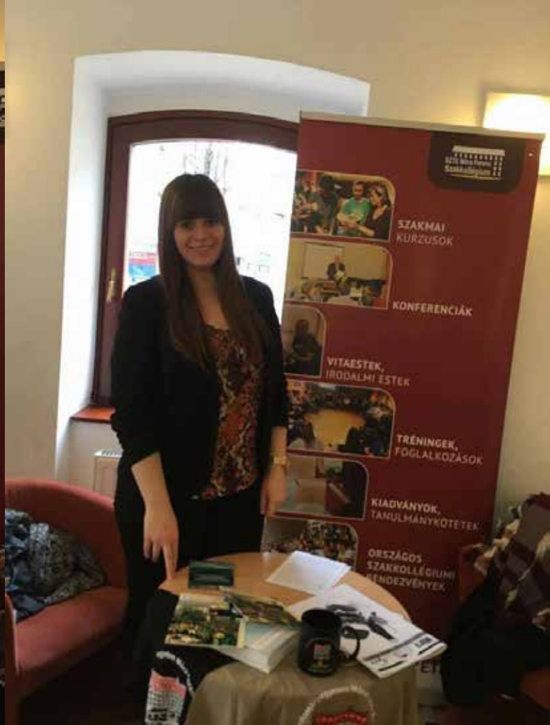
SZTE GAZDASÁGTUDOMÁNYI KAR - NYÍLT NAP - 2017.12.11.