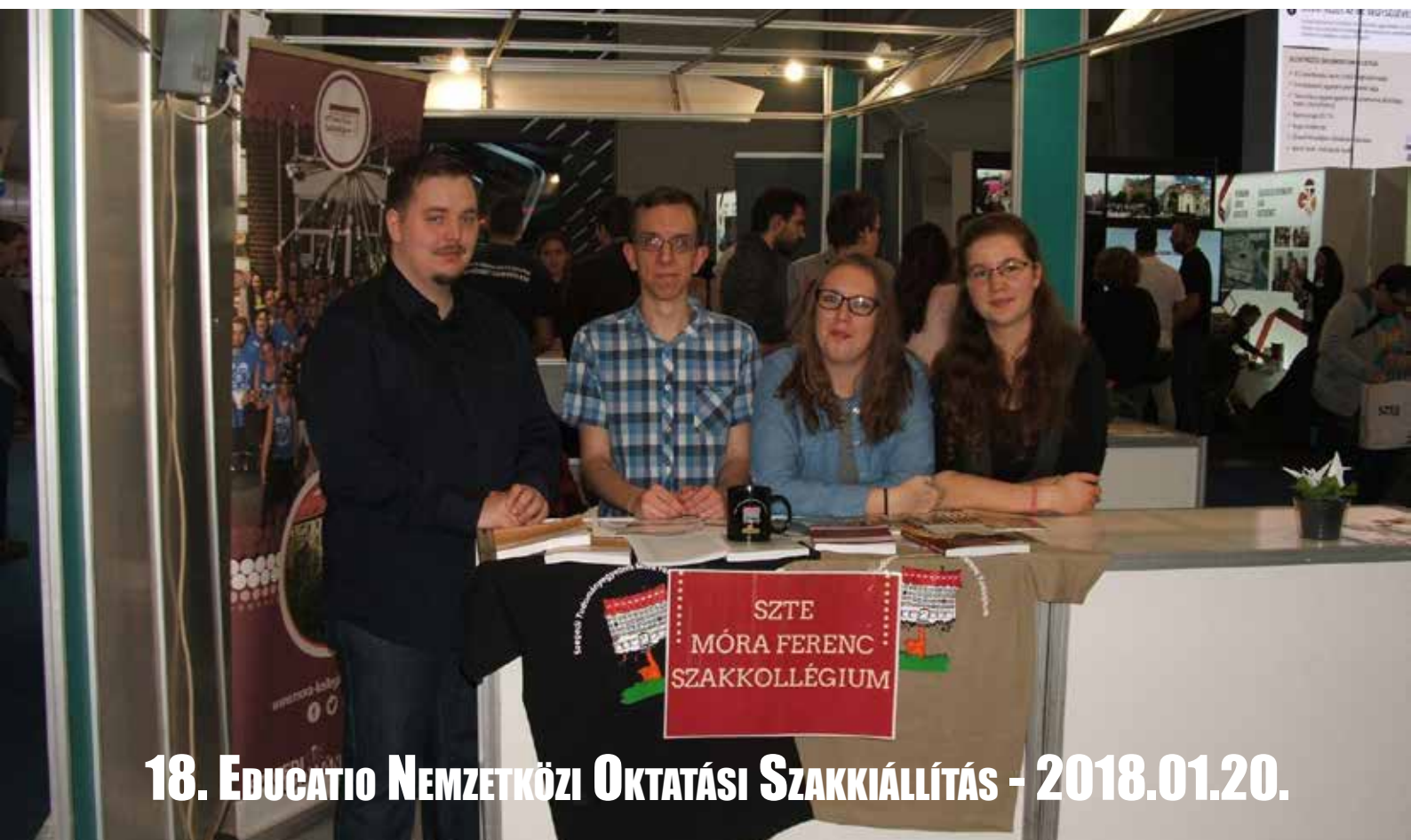
18. EDUCATIO NEMZETKÖZI OKTATÁSI SZAKKIÁLLÍTÁS - 2018.01.20.